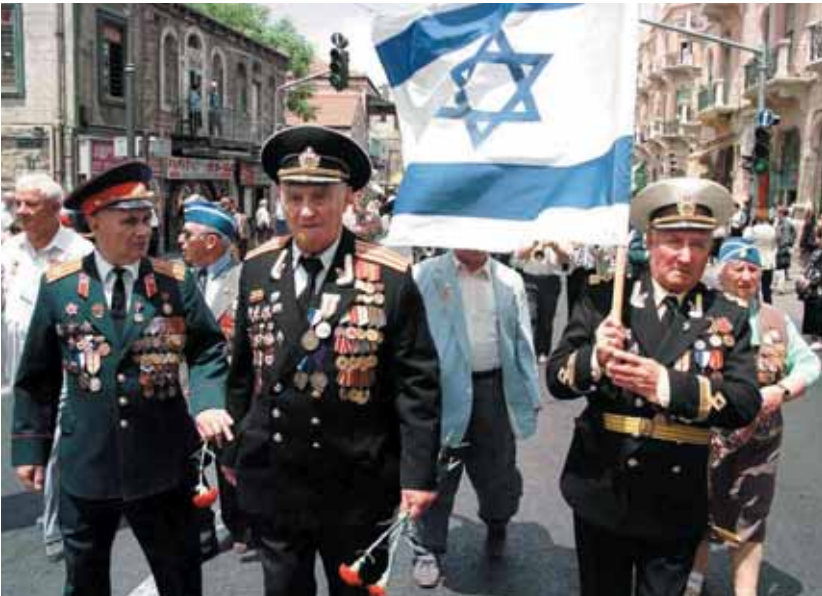
A szovjet hadsereg Izraelbe alijázott zsidó veteránjai minden május kilencedikén (a győzelem napja) felvonulnak Tel-Avivban és Jeruzsálemben.