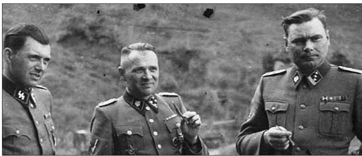
Josef Mengele, Rudolf Höss és Joseph Kramer

A feljegyzéseket Martin Broszat (1926–1989) adta közre és látta el bevezető tanulmánnyal. A német történész bevezetője szerint Höss emlékiratai kifejezetten cáfolják azt a leegyszerűsített elképzelést, amely szerint a tömeggyilkosság szükségképpen ördögi szadizmussal, állati brutalitással lenne párosítható.