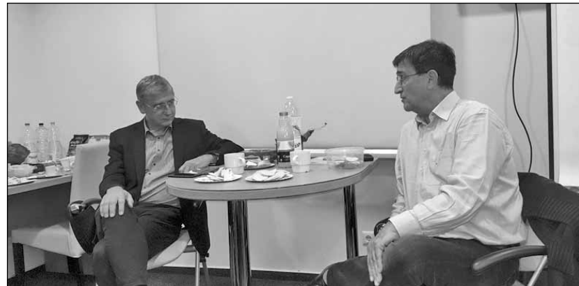
Egy a vendégek közül. Gyurcsány Ferenc

Ha nincs a PÁZSIT (csak a felettebb tájékozatlan újszülöttek, továbbá a marslakók kedvéért: Pápai Zsidók Társasága), tán sohasem vettem volna a fáradságot, hogy egyre dagadó kebellem lajstromozzam magamban, hány és hány pápaival büszkélkedhetünk, akik úgymond „vitték valamire”.