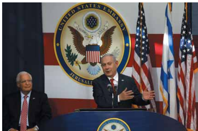
Amerika mögöttünk áll. Benjámín Netanjahu