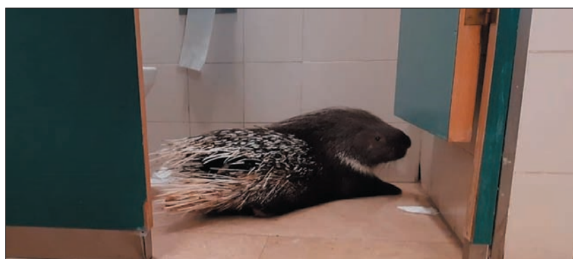
Indiai sül a Kneszet mosdójában

Az izraeli parlament őrsége azzal kereste meg a jeruzsálemi Természetvédelmi Hivatal munkatársait, hogy egy sül vette birtokába a Kneszet nyilvános