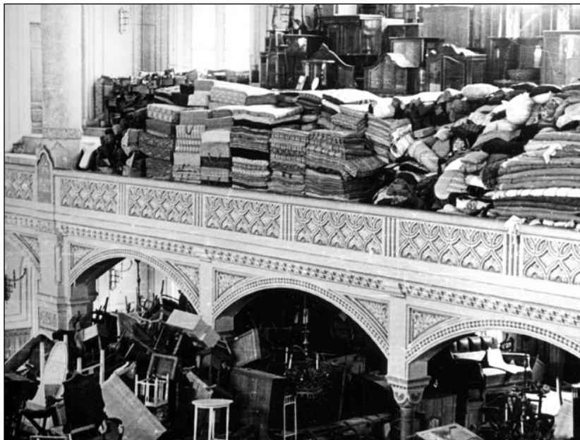
Elkobzott zsidó javak a szegedi zsinagógában, 1945

A megegyezés értelmében az OZSHA vissza-