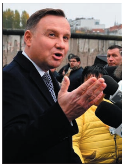
Duda nyilatkozik a televíziós stáboknak

Az államfő megjegyezte: az auschwitzi haláltáborban „paradox módon az emberiség is megnyilvánult”, „a végtelen kegyetlenség közepette a hősiességnek is helye volt”. Duda utalt a lengyel Honi Hadsereg katonájára, Witold Pileckire , aki 1940 szeptemberében saját elhatározásából zárattatta be magát a lág-