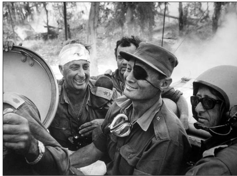
Ariel Saron és Mose Dajan az 1973-as jom kippúri háborúban

Dajant keményen bírálták a hírszerzési hibákért, a nem megfelelő értékelésből következő elbizakodottságért, még a barátjának számí-