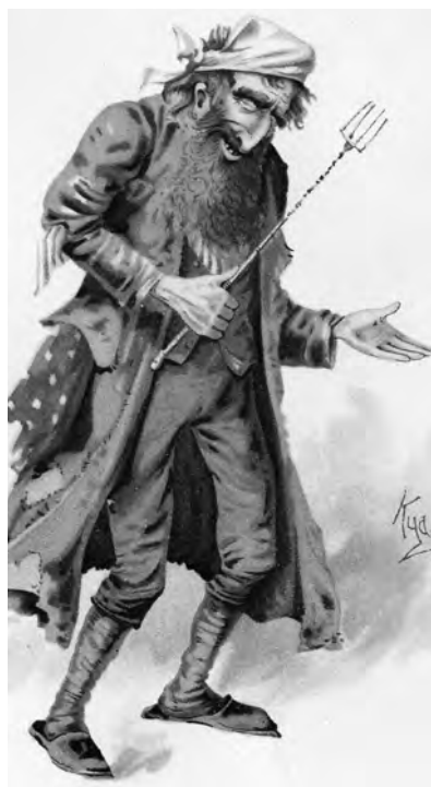
Fagin, az irodalmi antiszemitizmus terméke