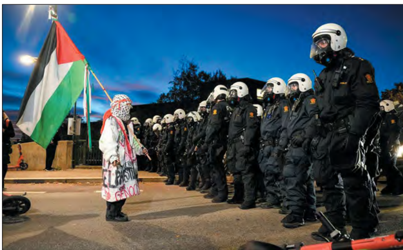
„Tülerőben” a rendőrség

„Míg a zsidó közösség a Kristályéjszakán történt szörnyű eseményekre emlékezik, egy nem zsidó szervezet, amely ellenzi a cionizmust és Izrael Államot, és amely nemrégiben közzétett jelentésében a palesztinokkal szembeni rasszizmust vizsgálja Norvégiában, szinte teljesen figyelmen kívül hagyva az