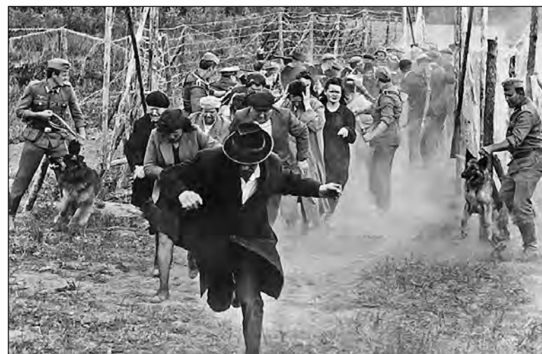
Jelenet a Babij Jarról szóló filmből