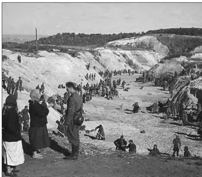
Szovjet hadifoglyok tömegsirt takarnak be a Babij Jar-i mészárlást követően

Az út végén a foglyoknak át kellett adniuk a csomagjaikat, le kellett vetközniük, és a halálmenet utolsó kilométerét meztelenül kellett megtenniük. A végső állomás a Babij Jar-i szurdok volt: egy 400 méter hosszú, 40-80 méter mély bemélyedés. A zsidókat csoportokra osztották, majd az első csoportot bevezették a szurdokba. A kiszolgáltatott emberekkel szemben MG-34-es gép-