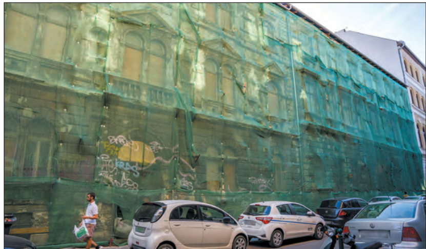
A Síp utcában itt lesz a luxusszálló garázsának főbejárata

tum szerint a munkálatok során igyekeznek majd a legtöbbet kihozni a rendelkezésre álló lehetőségekből, így a mostanra életveszélyessé vált épületek rövidesen első látásra kor-