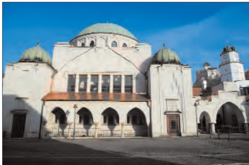
A trencsényi zsinagóga

Változást hozott, hogy az elmúlt években a Chábád is küldött rabbikat Tajvanra. A vallási élet erősítését jelentti, hogy befejezés előtt áll egy kö-