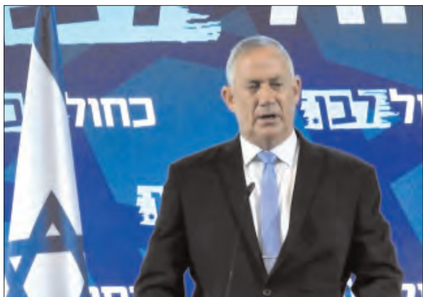
A Kék-Fehér vezetője, Beni Ganc volt vezérkari főnök

Zsidó szimbólumok és kegytárgyak már a múltban többször is eljutottak a világűrbe. Ramon, illetve korábban Jeffrey Hoffman egy kis méretű toratekerest vitt magával. Az amerikai Hoffman többször járt a világűrben, az egyik útja pont chanukka idejére esett, ezért chanukiját, a hagyományos gyertyatartót és egy chanukkai pörgetős játékot, trenderlit is elcsomagolt az űrre. Legutóbb pedig Jessica Meir villantott menőrákkal és Dávid-csillagokkal díszített zoknit a Nemzetközi Űrállomáson.