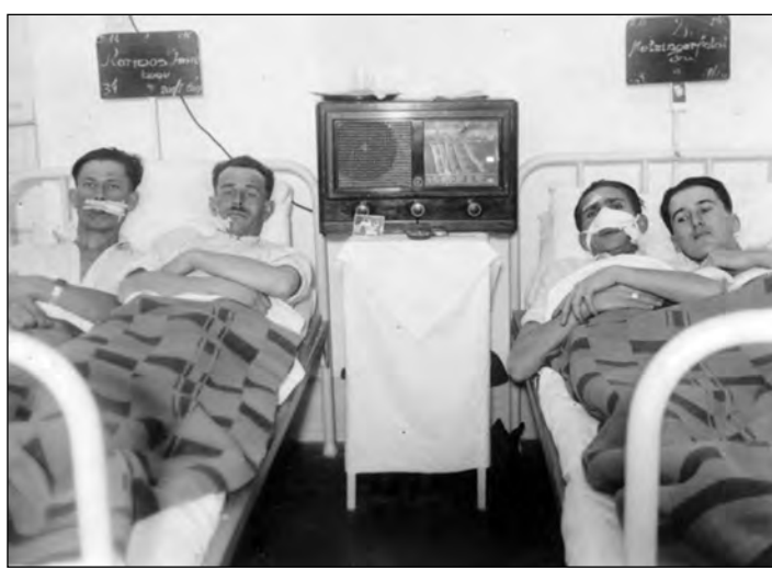
A nyilasokkal rokonszenvező újságíró a rádióból buzdította kitalásra a katonákat