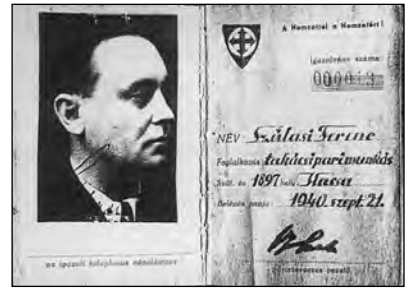
Szálasi Ferenc nyilas pártkönyve

A párt előzményei a 30-as évek radikális, antiszemita, nacionalista csoportjaiban keresendők. Szálasi célja nem csupán a politikai pozíció megszerzése volt, hanem egy teljes ideológiai rendszer létrehozása, amely a „magyar faj” felsőbbrendűségén és a nemzeti önrendelkezés eszméjén alapult.