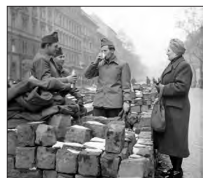
1956-os utcakép, szemben a rabbi-képzővel

Hogy is szól a közhely? Sic transit gloria mundi, így múlik el a világ dicsősége.