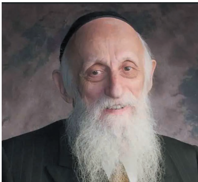
Abraham J. Twerski (1930–2021)