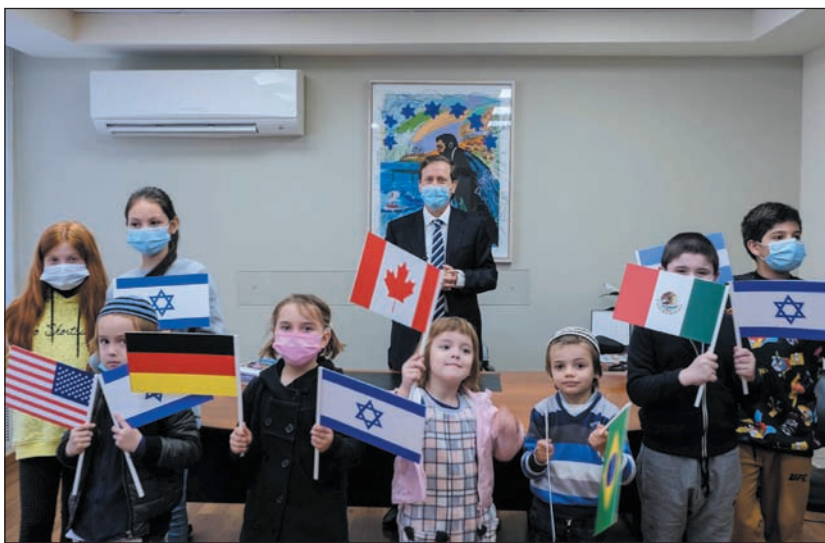
Jichák Hercog, a Szochnut elnöke új bevándorlókkal

Az új olé számára több ezer ember fogadására alkalmas karantén-szállót rendeztek be. A pandémia ide-