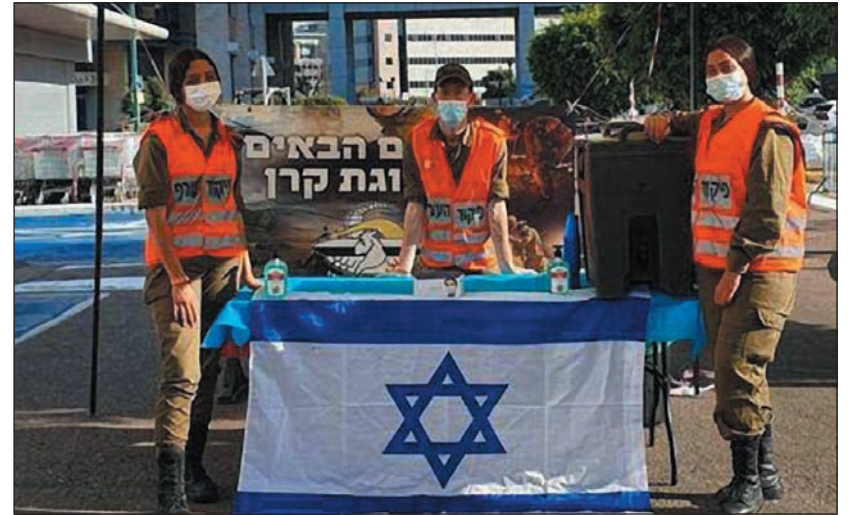
Az Izraeli Hadsereg polgári védelmi egységeinek katonái toboroznak Haifa városában

Az ország arab lakosságából mintegy ezer újonc vonult be a hadseregbe sorkatonai vagy tartalékos kiképzésre, ami több mint duplája az előző évek hasonló adatainak.